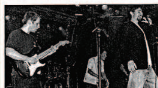
COOLCAVEMEN. De nouveau, changement de monde et même d'horizon musical car ce groupe fait office d'ovni dans l'affiche !!