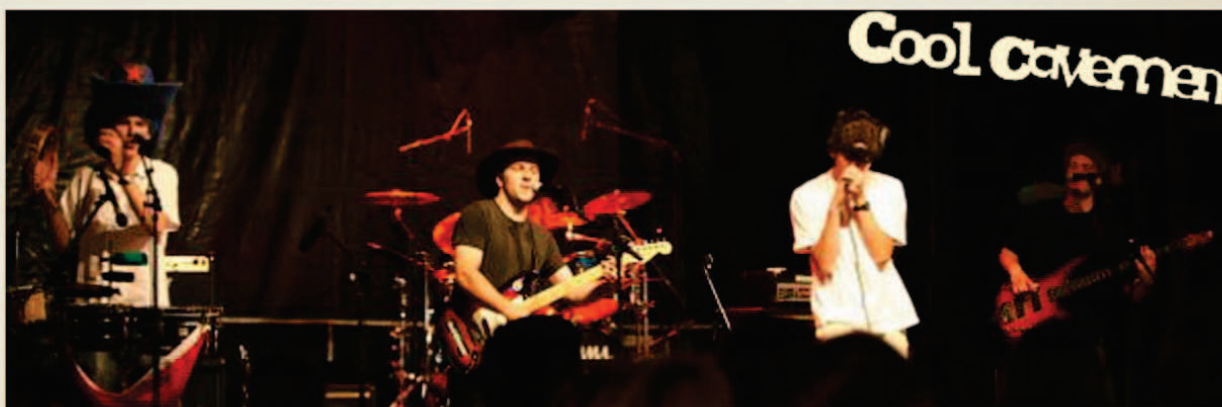
Raismesfest, septembre 2007

Cool Cavemen nous propose un show où la mise en scène rivalise avec l'humour... ainsi déguisements, couvre-chefs et participation du public sont de mise.