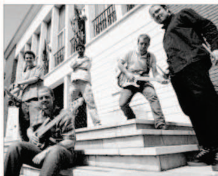
De la polka à la country, les cinq compères n'hésitent pas à mélanger les styles. Résultat, des compos furieuses et toniques.

sonnalités... et puis on s'éclate ! » Les guillards aiment à se déguiser. Mais sans aller jusqu'à copier Marcel et son orchestre : « Le déguisement c'est leur fonds de commerce, se défend Thomas, le batteur. Chacun de leurs concerts est presque un petit carnaval de Dunkerque. Nous préférons les chins d'ail. » Comme de porter des chapeaux de cow-boys lorsqu'ils jouent leur balade country. Si le star-system ne les attire pas, il est en revanche un vœux cher à leur yeux : pouvoir vivre de leur talent. « Un rêve dans lequel on essaye de mettre un maximum de billes », soupire Max. C'est tout le mal qu'on leur souhaite. ■ C. L.-S.